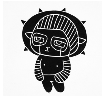
Janne Juvi Rasmussen

I Expedition of Printmakers: Nye Trykk har man ønsket å gå motstrøms, og la det spesifikke ved grafikken stå sentralt i en virkelighet preget av digitale medier. Visjonen har vært å løfte frem og fokusere på de tradisjonelle grafiske teknikkene og vise at nettopp disse kan være grunnlaget for nyskapende trykk.