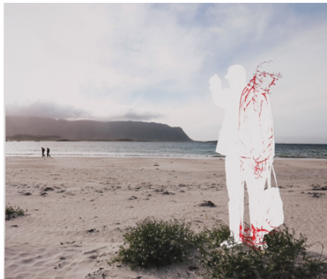
Grete Irene Einarsen