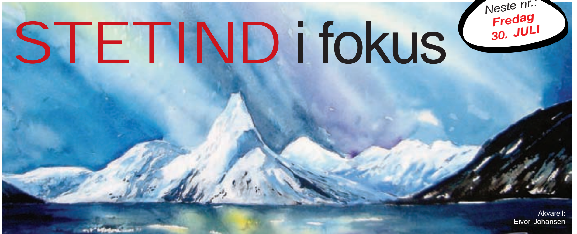
Akvarell: Eivor Johansen

Ikke bare blant fjellklatrere er Stetind populær og ettertraktet. Også mange kunstnere har gjennom tidene latt seg begeistre og inspirere av Stetind. I sommer viser lokale kunstnere mange variasjoner av nasjonalfjellet på Tysfjord Turistsenter.